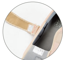
長さ調整できるベルト むくみも安心