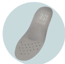
足腰を労わるアーチ サポート付インソール