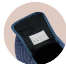
名前が書ける サイズタグ