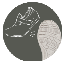
つまずきにくい・すべりにくい・歩きやすい靴底